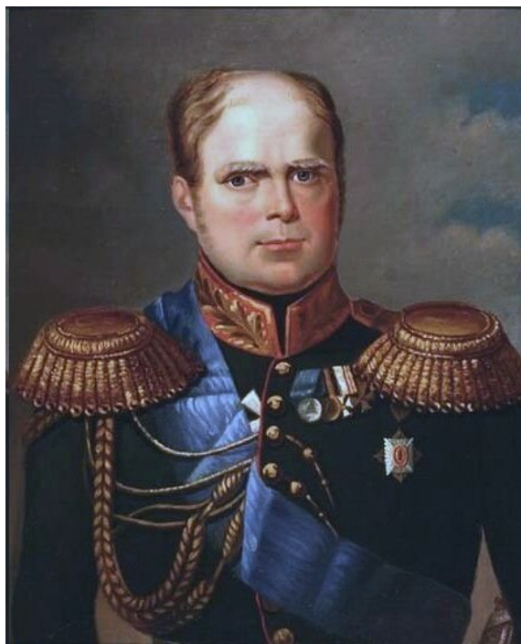
Konstanty Pawłowicz Romanow (1779–1831), wielki książę rosyjski, brat Aleksandra I i Mikołaja I, naczelny wódz armii Królestwa Polskiego, generał kawalerii rosyjskiej. Wskaż elementy sugerujące związku księcia z armią.

Imperatora szczególnie irytowała aktywność liberalnego stronnictwa sejmowego, nazywanego kaliszczanami z racji pochodzenia braci Wincentego i Bonawentury Niemojowskich. Aleksander uważał się za dobroczyńcę Polaków i wszelkie działania opozycyjne, nawet w ramach konstytucyjnych uprawnień, traktował jako wyraz niewdzięczności. Kaliszczanie spotykali się też często z krytyką ze strony bardziej ugodowo nastawionych rodaków, argumentujących, że ich działalność opóźnia obiecane przez imperatora przyłączenie do Królestwa wschodnich ziem dawnej Rzeczypospolitej, które zaczęto wówczas określać mianem ziem zabranych. Na zmianę stosunku władz rosyjskich do Polaków wpłynęła jednak w znacznie większym stopniu ewolucja poglądów Aleksandra I, który pod wpływem wystąpień rewolucyjnych w Europie Zachodniej, a nawet w samej Rosji tracił sympatię dla liberalizmu i coraz chętniej dawał posłuch swym najbardziej konserwatywnym doradcom. Eksperyment z monarchią konstytucyjną w Kongresówce cesarz zaczął uważać za nieudany, co skutkowało wprowadzeniem cenzury, ograniczeniem interpelacji poselskich, a w końcu – utajnieniem obrad sejmu.