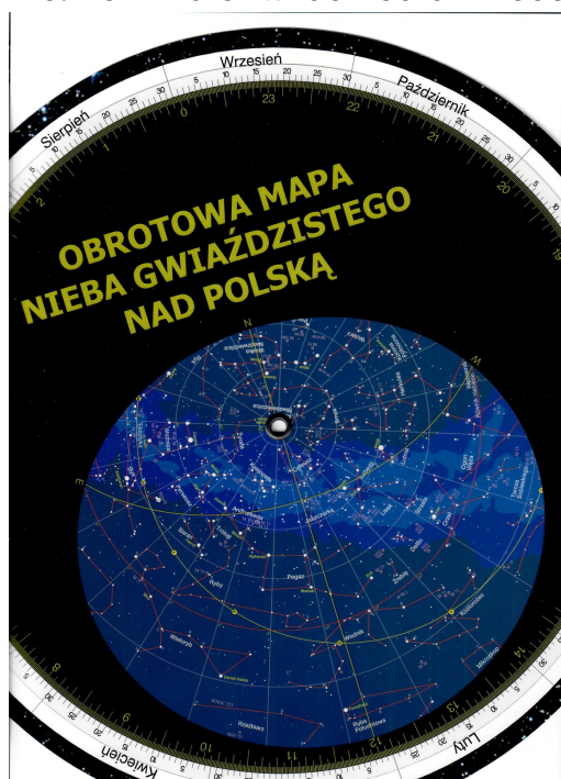
Rys. 2. Obrotowa mapa nieba, ustawiona na północ czasu słonecznego pierwszego września.

w wyniku obrotu Ziemi wokół własnej osi. Dlatego o różnych godzinach znajdują się one w różnych miejscach. Aby znaleźć obiekt, który nas interesuje, potrzebujemy mapy nieba. Najprostszą i najporęczniejszą jest obrotowa mapa nieba. Dlaczego nazywamy ją obrotową? Ponieważ uwzględnia ona obrót sfery niebieskiej, który jest konsekwencją obrotu Ziemi. Dzięki niej zobaczymy, jak wygląda niebo w wybranym przez nas dniu i godzinie, z dokładnością do kilku minut. Mapa składa się z dwóch kół połączonych wspólnym środkiem. Na jednym z nich narysowane są wszystkie gwiazdozbiory nieba północnego, czyli widzianego nad Polską. Na jego krawędzi znajduje się miarka z zaznaczonymi miesiącami i dniami. Drugie koło jest częściowo przezroczyste, aby pokazywać odpowiedni fragment pierwszego koła. Ustawiając mapę na odpowiedni dzień i godzinę, w przezroczystej części koła zobaczymy dokładnie te gwiazdozbiory, które można obserwować o tej właśnie porze. Po kilku chwilach obraz nieco się zmieni.