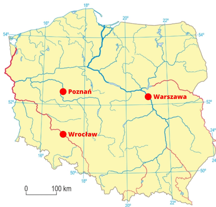
Rys. 3. Długości geograficzne w Polsce.