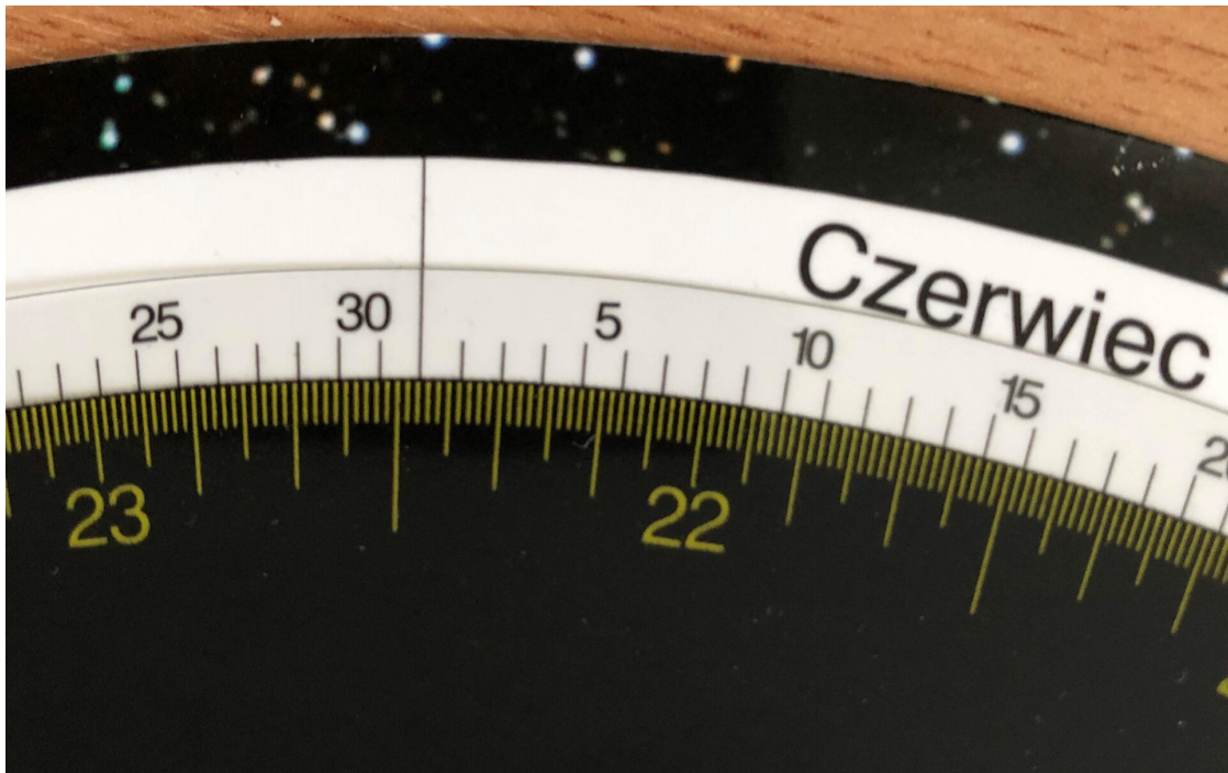
Rys. 4. Ustawienie mapy nieba na datę 2.06. (czarna podziałka) i godzinę 22:24 (żółta podziałka).