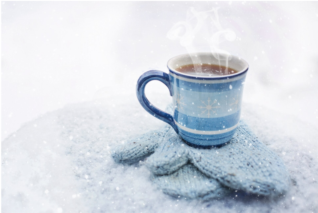
Fot. a. Zdjęcie kubka z parującym napojem.

A o czym mówi I zasada termodynamiki? Wyjaśnia ona, w jaki sposób może zmienić się energia wewnętrzna ciała, oraz podaje sposób na obliczenie tej zmiany.