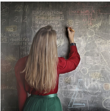
Nauka i praca w UE