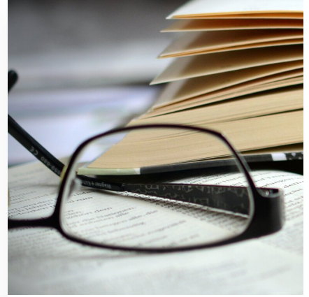
Edukacja a rynek pracy