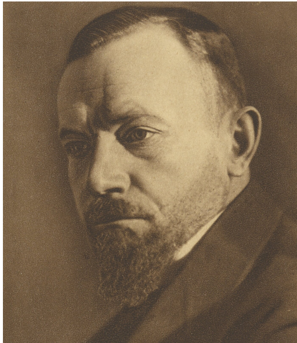
Leopold Staff na pocztówce z 1933 roku.