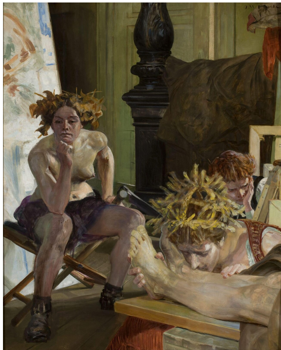
Jacek Malczewski, Śmierć artysty , 1909.

W dobie Młodej Polski najbardziej uprzywilejowaną formą wypowiedzi literackiej była poezja. Szczególnie cenioną jej właściwością było niecodzienne użycie języka. Liryka miała opisywać to, co tajemnicze, nienazwane – być wyrazem doniosłych przeżyć, potężnych namiętności i bardzo osobistych, wręcz intymnych doznań. Wszelką trywialność, pospolitość tematu, a nawet jakikolwiek związek z namacalną rzeczywistością traktowano jako wykroczenie przeciw sztuce poetyckiej. Tendencja ta objawiła się w niechęci do poezji opisowej, którą uznano za zbyt podobną do prozy. Odtąd wiersz nie miał niczego nazywać wprost, lecz jedynie sugerować stany duszy niedające się wyrazić powszednimi słowami i „zwyczajnymi” wyrażeniami.