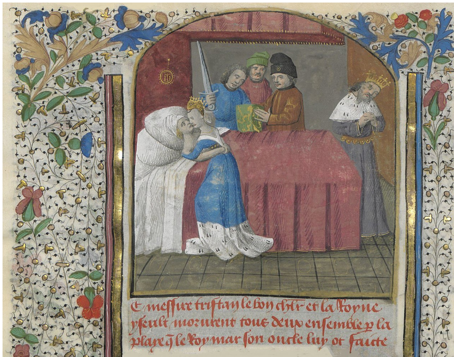
Śmierć Tristana i Izoldy, miniatura z XV wieku