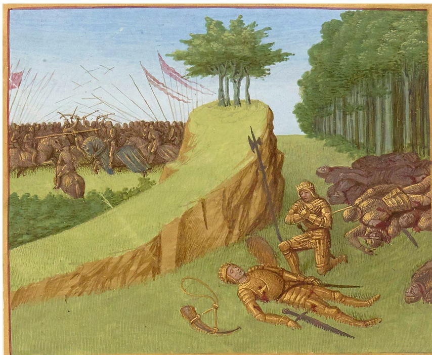
Jean Fouquet, Śmierć Rolanda w bitwie pod Roncevaux , ilustracja z manuskryptu, ok. 1455–1460