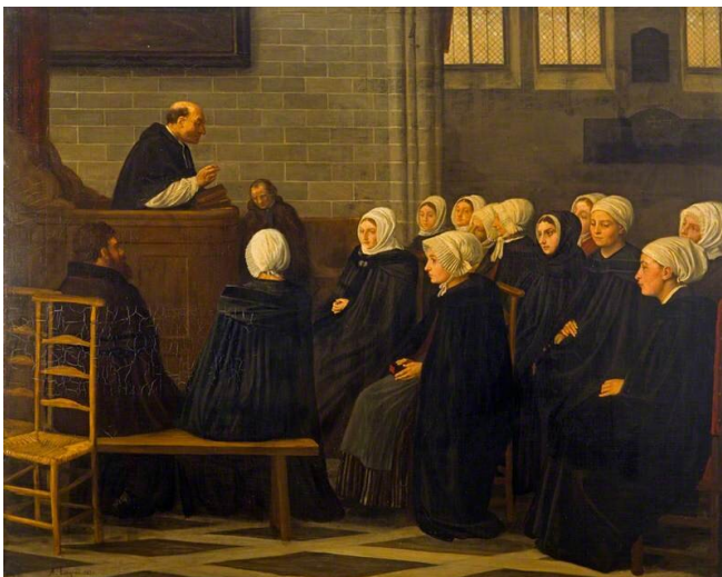
Alphonse Legros, Kazanie , 1871