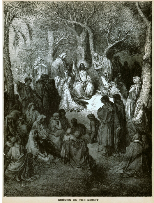
Gustave Doré, Kazanie na górze , 1866

Kazanie to kierowana do odbiorców przemowa, najczęściej o charakterze religijnym. Ma na celu przekonanie do pewnych racji. Jako gatunek literacki ten typ wypowiedzi wywodzi się z mów kapłanów do wiernych wygłaszanych podczas obrzędów liturgicznych (element rytuału religijnego). Forma kazania to ważny element nauczania w kościołach chrześcijańskich – kapłan wyklada podstawy wiary, komentuje fragmenty Pisma Świętego bądź przekazuje pouczenia moralne. Kazanie ma zatem cel dydaktyczno-moralizatorski i należy do literatury parenetycznej – kształtuje pożądane postawy, ukazuje i propaguje wzorce osobowe, prezentuje przykłady godne naśladowania, często zawiera rady i wskazówki. Do kazań należą zarówno teksty oracji, jak i utwory przeznaczone do czytania. Ważną cechą kazania jako gatunku jest kreacja podmiotu lirycznego. Jest on nieodmiennie wzorem – tym, który naucza, a więc posiada jakąś szczególną wiedzę i autorytet moralny. Kazania dotyczą głównie problemów teologicznych, filozoficznych, ale poruszają także problematykę społeczną czy polityczną. Zbiory takich tekstów często pełnią funkcje użytkowe. Autorzy przedstawiają w nich wybrane zagadnienia, starając się w wyczerpujący sposób odpowiedzieć na dylematy odbiorców.