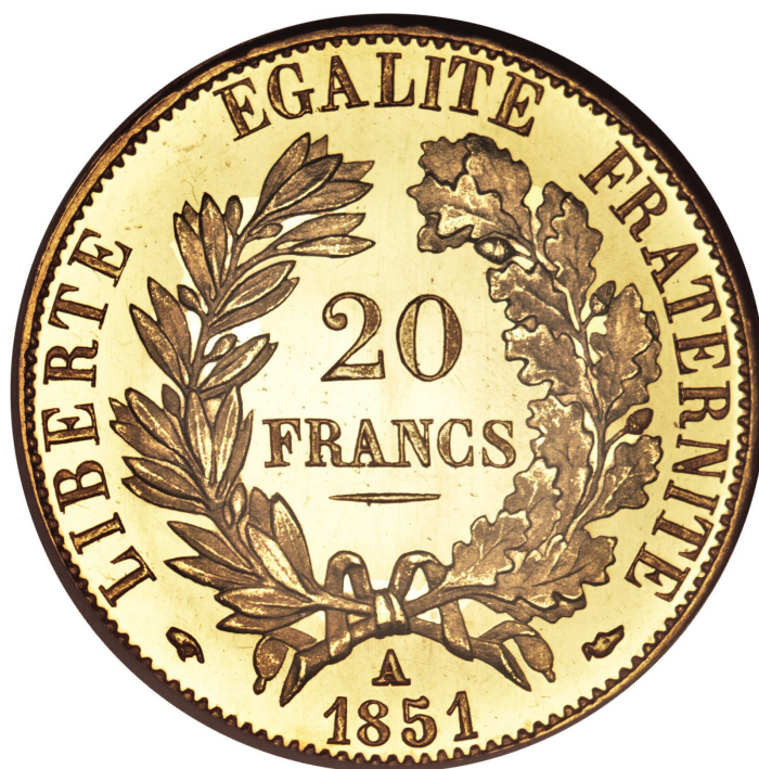
20 franków z napisem Wolność, równość, braterstwo

W życiu społecznym pojawiają się słowa, za którymi kryją się idee lub wartości podzielane przez większą grupę ludzi. Wyrazy te nabierają znaczenia w ważnych momentach historycznych, określając kulturę danego społeczeństwa. Mogą wyzwalać dodatkowo różne uczucia (np. ważnymi znakami kultury francuskiej są pojęcia: wolność – równość – braterstwo , czyli hasła wywodzące się z rewolucji francuskiej).