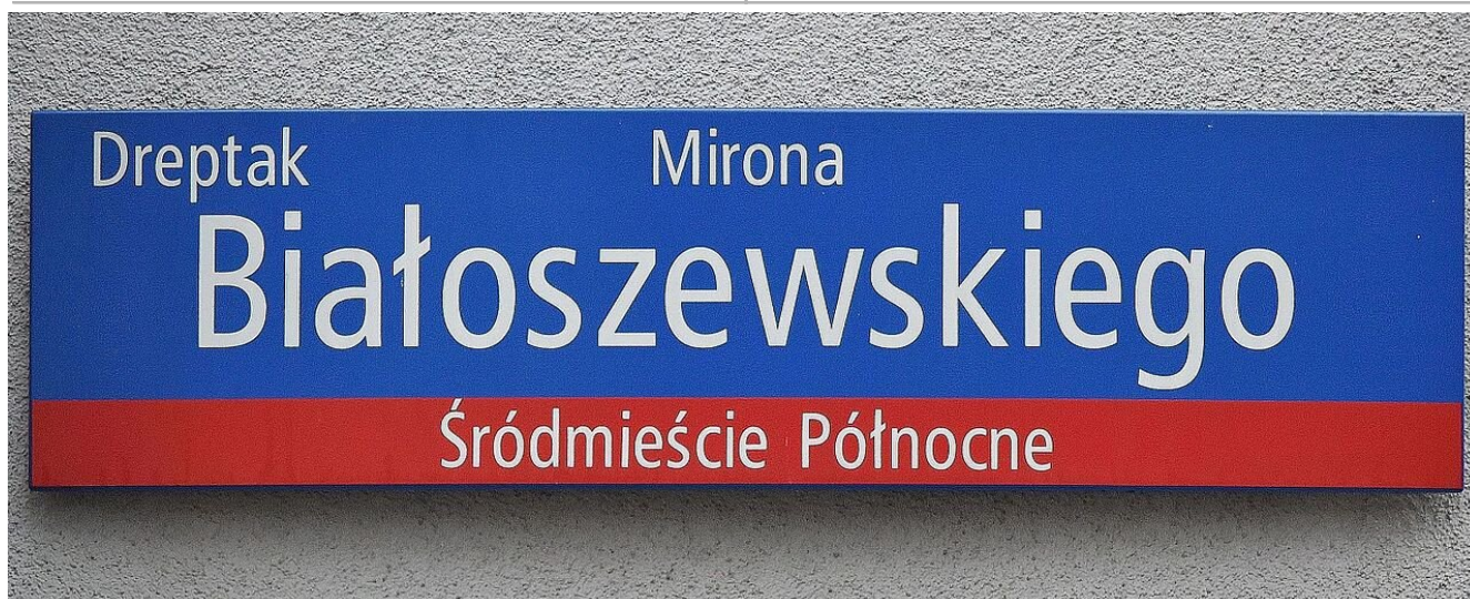
Tablica MSI na bocznej ścianie budynku przy placu Dąbrowskiego 7 w Warszawie