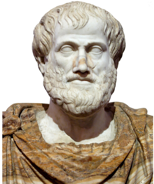
Popiersie Arystotelesa – rzymska kopia rzeźby Lizypa wykonanej w brązie ok. 330 p.n.e., toga dodana współcześnie

Wszystkie rzeczy ożywione (rośliny, zwierzęta, ludzie) posiadają zdolność do pobierania pokarmu, rośnięcia i rozmnażania. Wszystkie żywe istoty (zwierzęta i ludzie) mają również zdolność wyczuwania