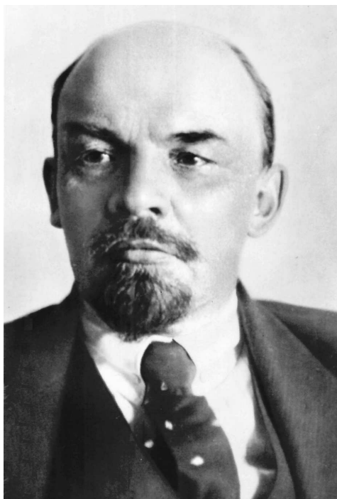
Lider Rosyjskiej Partii Komunistycznej (bolszewików)

Źródło: a. nn., Lider Rosyjskiej Partii Komunistycznej (bolszewików) , 1918, domena publiczna.