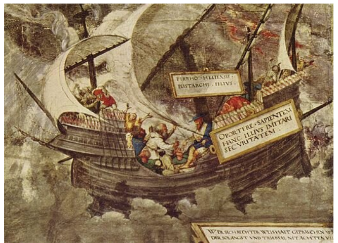
Petrarcameister, Obojętność filozofa Pyrrusa podczas burzy – obraz z I połowy XVI wieku.