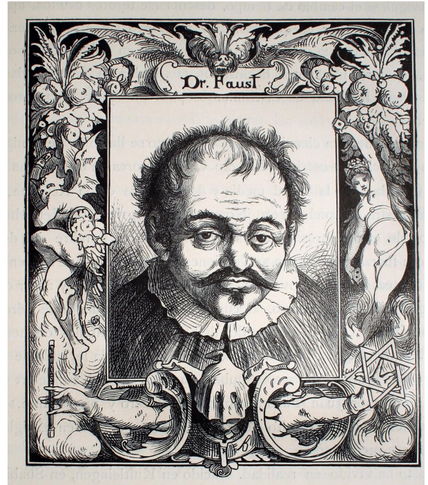
Rycina przedstawiająca doktora Fausta

Pełna tajemnic biografia Doktora Fausta cieszyła się ogromnym zainteresowaniem, dzięki czemu średniowieczny alchemik stał się bohaterem wielu prac literackich. W 1587 roku ukazała się Historia doktora Jana Fausta, szeroko okrzychanego czarnoksiężnika i maga – książka jarmarczna, które cieszyła się dużą popularnością. Do końca XVI wieku pojawiło się 25 wydań tego dzieła, zostało ono również przetłumaczone na inne języki: francuski, angielski, niderlandzki oraz czeski. W 1604 roku wydano sztukę Christophera Marlowe'a; Tragiczne dzieje doktora Fausta . Postać Fausta zagościła również w ulicznych teatrzykach. Goethe nad swoją wersją historii słynnego alchemika pracował wiele lat. Doktor filozofii z Wittenbergi stał się dla niego symbolem poszukiwania prawdy oraz nieprzezwyciężonego pragnienia zdobywania wiedzy.