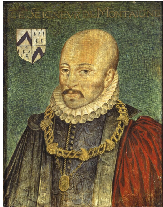
Portret Michel'a de Montaigne, autor nieznany, ok. 1578

Po drugie należy pamiętać, że introspekcja filozofa nigdy tak naprawdę nie jest do końca introspekcją. Kartezjusz pozornie zanurza się wyłącznie w świecie własnych doznań, w istocie jednak, za sprawą swojego gruntownego wykształcenia filozoficznego, prowadzi też wewnętrzny dialog z innymi filozofami, z ich doświadczeniami i argumentami. Kiedy więc Kartezjusz powołuje się na przykład na złudność doznań zmysłowych, nie odwołuje się w ogóle do własnych doświadczeń, albo nie tylko do nich, ale do argumentów i przykładów analizowanych przez filozofów co najmniej od czasu antycznego sceptycyzmu.