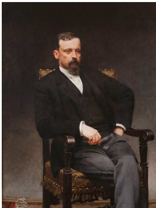
Kazimierz Pochwański, Portret Henryka Sienkiewicza (1890).