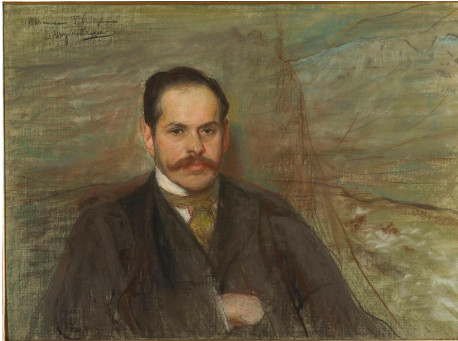
Leon Wyczółkowski, Portret Kazimierza Przerwy-Tetmajera (przed 1901).

Źródło: Wikimedia Commons, domena publiczna.