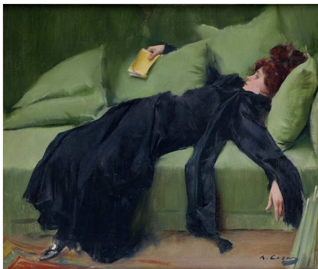
Ramon Casas i Carbo, Młoda dekadentka (1899).

XIX Przerwa-Tetmajer zwrócił uwagę na konsekwencję materialistycznego światopoglądu dominującego w poprzedniej epoce. W obliczu nieubłaganych praw natury człowiek staje się igraszką sił, na które nie ma żadnego wpływu. Tak jak „mrówka rzucona na szynę” nie może walczyć z „pociągami nadchodzącymi w pędzie”, istota ludzka nie może wystąpić przeciw deterministycznym zależnościom biologii i fizyki. Wszelka próba wykroczenia poza ramy wyznaczone przez naukowy obraz świata będzie tylko bezowocnym szamotaniem się. Dlatego podmiot liryczny ogarniają melancholia i poczucie pustki.