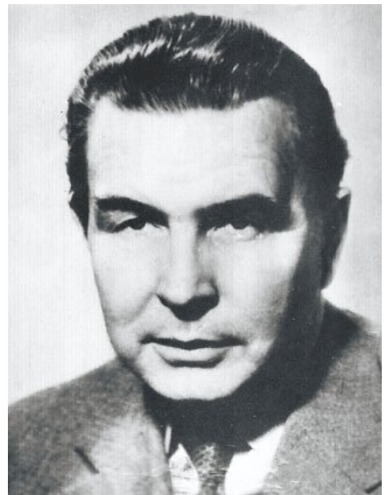
Adam Rapacki (1909–1970)

W nurt detente (odprężenia) wpisywały się stosunki między PRL a Republiką Federalną Niemiec. W listopadzie 1970 roku parafowany został układ między oboma państwami, w którym m.in. odnoszono się do granicy na Odrze i Nysie Łużyckiej, uznając ją