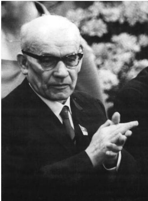
Władysław Gomułka (1956–1982)