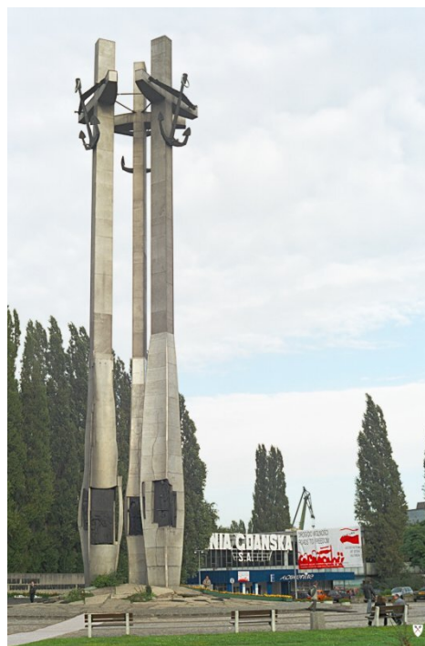
Pomnik Poległych Stoczniowców w Gdańsku.

20 grudnia, pod nieobecność Władysława Gomułki (przebywał w klinice rządowej), na VII Plenum PZPR wybrano nowego I sekretarza partii. Został nim Edward Gierek.