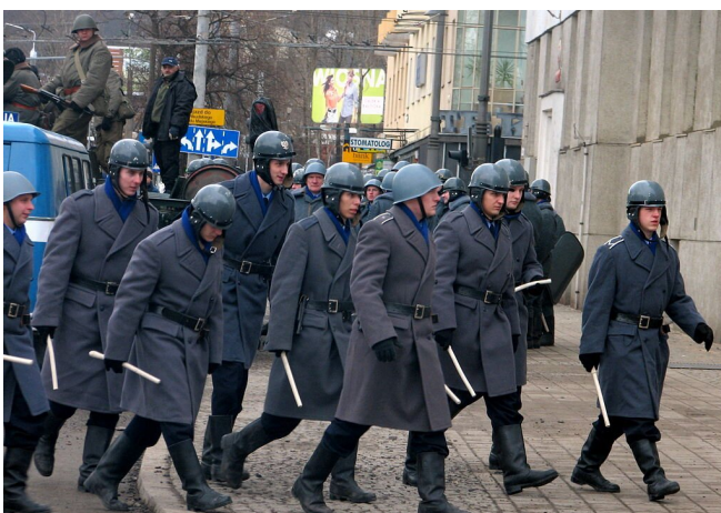
Oddział milicji, kadr z filmu Czarny czwartek o wydarzeniach Grudnia '70.

Po południu doszło w Gdańsku do pierwszych starć robotników z milicją. Do miasta przybyła większa ekipa przedstawicieli władz państwowych i partyjnych, jednak do rozmów nie doszło. Następnego dnia strajk ogarnął również Gdynię, tam jednak przebiegał bardzo pokojowo.