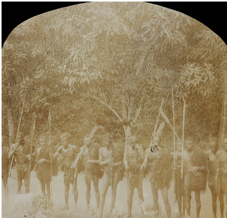
Afrykańskie plemię w strojach do polowania, Kongo, ok. 1900–1915