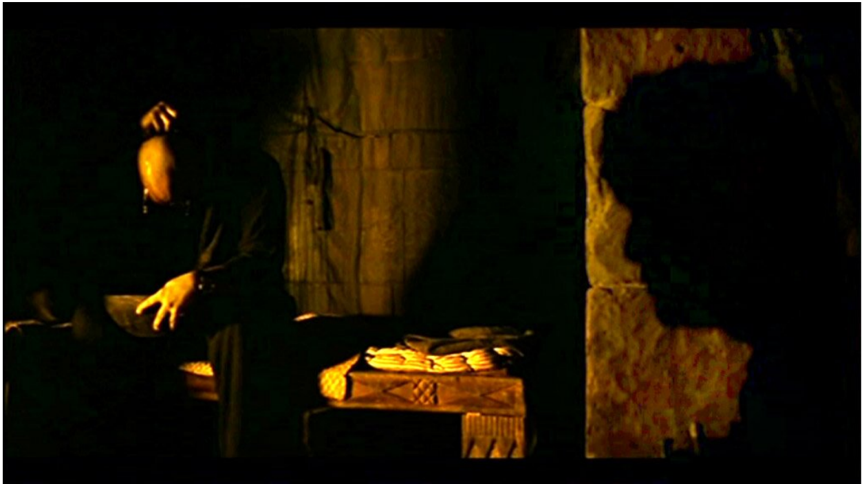
Czas apokalipsy (1979), kadr z filmu