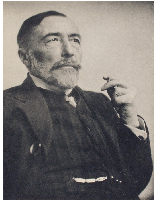
Joseph Conrad, fotografia z 1916 roku

Joseph Conrad, właśc. Józef Teodor Konrad Korzeniowski herbu Nałęcz (1857–1924), był angielskim pisarzem polskiego pochodzenia, który osiągnął sukces poza granicami swojej ojczyzny. Nie pisał w języku ojczystym, lecz publikował po angielsku pod pseudonimem Joseph Conrad. W przeciwieństwie do innych twórców swojego pokolenia, nie poświęcił się służbie narodowo-wyzwoleńczej i rzadziej poruszał tematykę związaną z polskością. Doświadczenia życiowe Conrada były związane przede wszystkim z podróżami i żeglarstwem, co uzasadnia wybór tematów jego dzieł. Zajmując się między innymi mrokami epoki kolonialnej, wyprzedził niektóre postkolonialne refleksje. W 1894 roku zamieszkał na stałe na Wyspach, dzięki czemu jego twórczość miała szansę zaistnieć na arenie międzynarodowej.