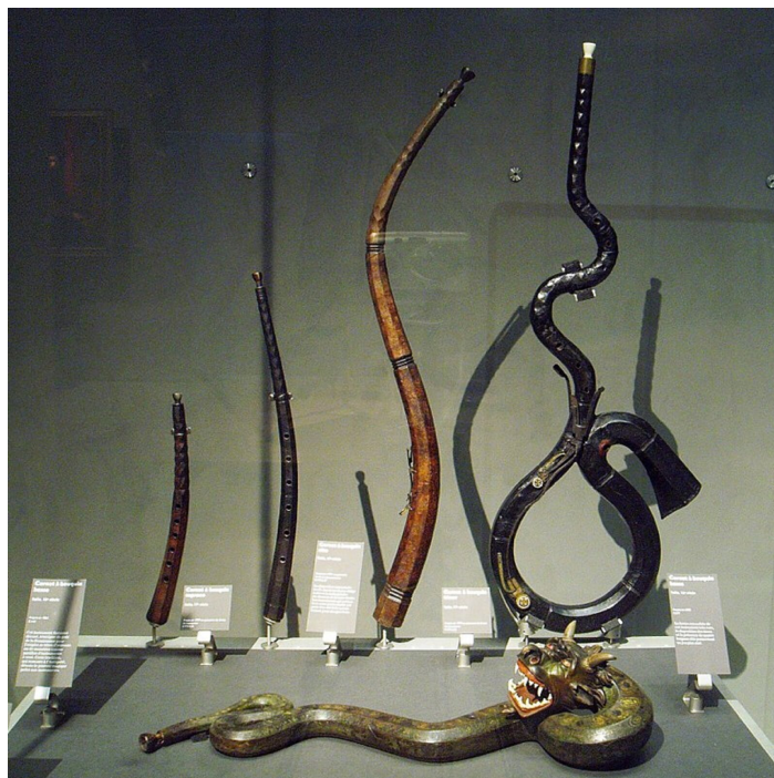
Kolekcja cynków w różnych rozmiarach. Paryż, Musée de la Musique, Wikipedia.org, CC BY 3.0

Nagranie dostępne na portalu epodreczniki.pl