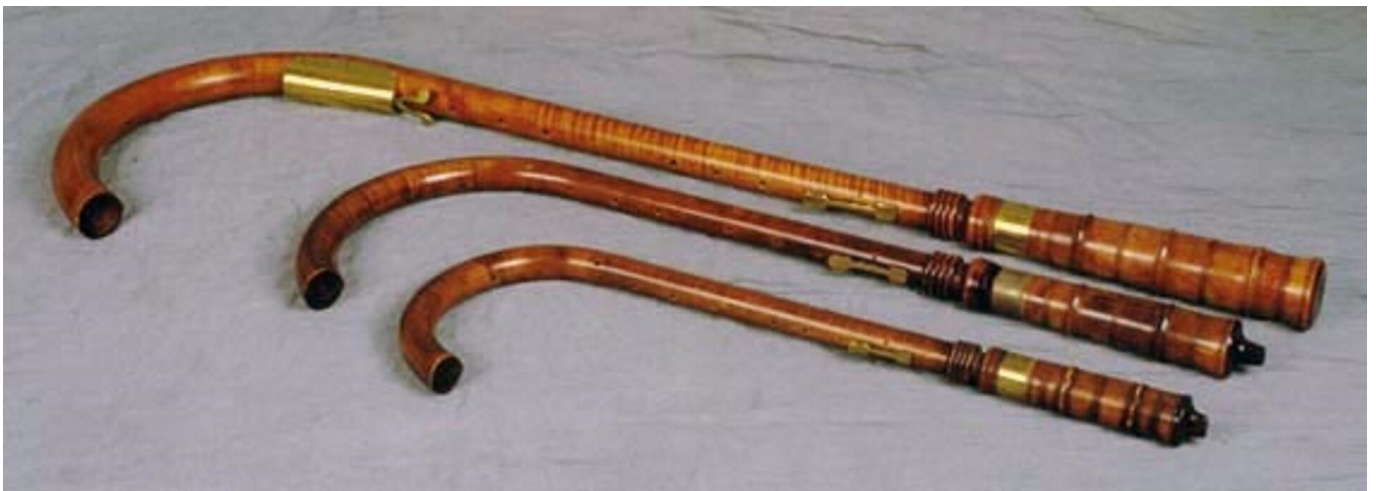
Trzy krzywuły o różnych wielkościach (i skalach), tworzące razem konsort

Krzywuła (krumhorn) – zupełnie nowy XV-wieczny wynalazek to instrument powstały około 1400 r., od swego kształtu zwany po polsku krzywułą (inne nazwy: krzywuł, krzywul, kromorn , niem. Krummhorn , franc. cromorne ). Jest to aerofon stroikowy z podwójnym stroikiem umieszczonym – co szczególne – w zamkniętej cylindrycznej komorze, do której muzyk wdmuchuje powietrze, nie dotykając stroika ustami. Był to najstarszy europejski aerofon posiadający komorę stroikową. Te specyficzne instrumenty, złożone z zagiętej cylindrycznej rury drewnianej z 7 otworami bocznymi i zdejmowanej komory stroikowej, były budowane w różnych rozmiarach i łączone w wielogłosowe zespoły (konsorty). Krzywuła ma brzmienie o łagodniejszej i ciemniejszej barwie niż pomort, ale również jest poprzednikiem oboju. Czas największej popularności krzywuł przypadał na wiek XVII. W kolejnym stuleciu szybko wyszły z użycia.