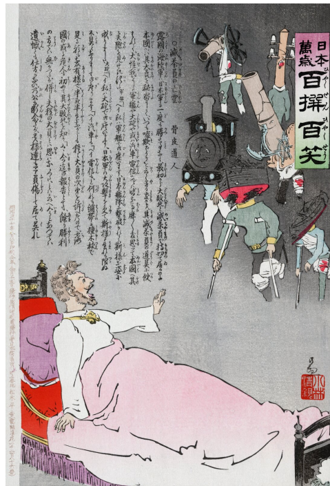
Powrót sił zbrojnych. Koszmar senny Mikołaja II

Źródło: Kobayashi Kiyochika, Powrót sił zbrojnych. Koszmar senny Mikołaja II , 1904, domena publiczna.