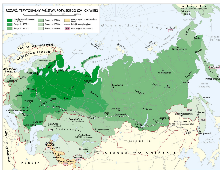
Rozwój terytorialny państwa rosyjskiego (XV-XIX wiek)

Na początku XX wieku Rosja zapewniła sobie wpływy w Korei, bogatej w surowce naturalne: żelazo, węgiel, złoto, bogactwa leśne. Jej wojska wkroczyły też do Mandzurii, gdzie utworzyła własną strefę wpływów. Toteż siłą rzeczy car i jego otoczenie byli zaniepokojeni japońską polityką zmierzającą do zagarnięcia Korei.