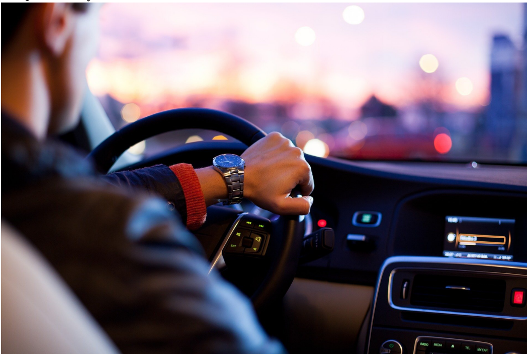
Rys. 3. Kierowca hamuje widząc czerwone światło.

Droga przebyta przez ciało poruszające się ruchem jednostajnie opóźnionym wyraża się wzorem: s(t) = -\frac{1}{2}at^2 + v_0t . Aby obliczyć drogę, którą ciało przebyło od t=0 do chwili t – zaznaczonej na wykresie (Rys. 2.), musimy obliczyć pole zakreskowanego obszaru. Więcej na ten temat możesz przeczytać w e-materiale „Zależność drogi w funkcji czasu w ruchu jednostajnie opóźnionym”.