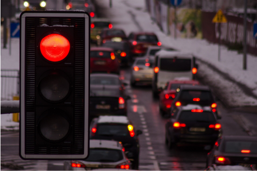
Rys. 1. Czerwone światło to sygnał do zatrzymania.