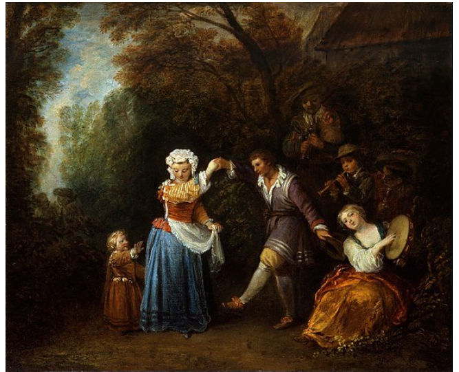
Antoine Watteau, Taniec wiejski

Sentymentalizm to jeden z głównych – obok klasycyzmu – prądów umysłowych i literackich epoki oświecenia. Jego prekursorem był Jan Jakub Rousseau – autor powieści w listach Julia, czyli Nowa Helioza (1760), w której podkreślił rolę natury w życiu człowieka. Rousseau przeciwstawił naturę cywilizacji oraz uczucia rozumowi. Stworzył ideał człowieka wrażliwego (fr. sensible ). Nazwa nurtu wywodzi się od tytułu powieści Laurence’a Sterne’a Podróż sentymentalna przez Francję i Włochy (1768).