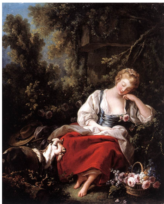
François Boucher, Rozmarzona pasterka , ok. 1763.