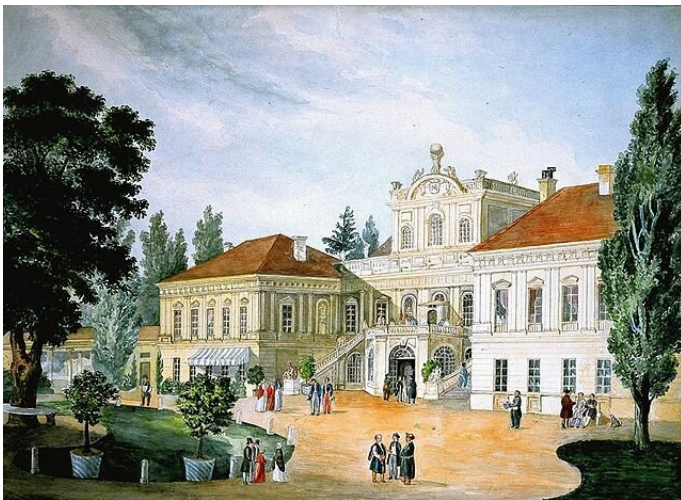
Dwór Czartoryskich w Puławach