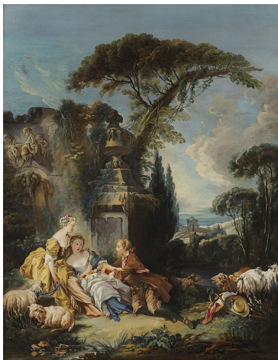
François Boucher, Scena pastoralna , 1730–1760.

Obejrzyj galerię i wybierz obraz François'a Bouchera, który twoim zdaniem może być ilustracją sielanki Franciszka Karpińskiego Laura i Filon . Sformułuj odpowiedź, w której uzasadnisz swój wybór.