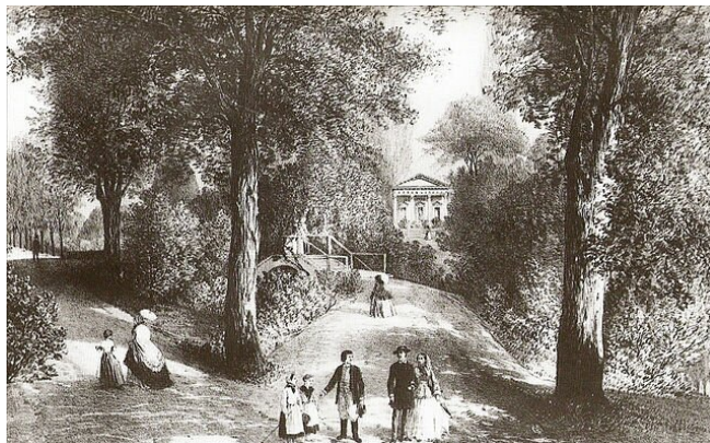
Ogród w stylu angielskim w Puławach

sentymentalnego, który chętnie przebywał na łonie natury, a jednocześnie patrzył na świat przez pryzmat miłości, analizował własne przeżycia i łatwo się wzruszał.