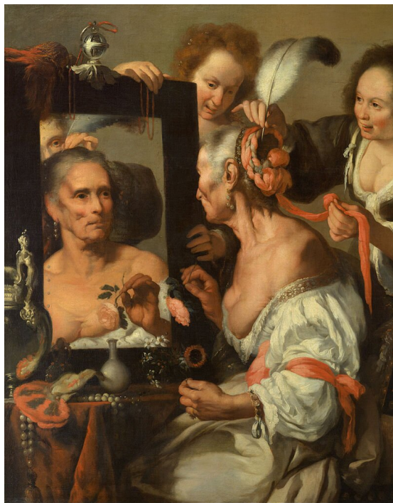
Stara kobieta przed lustrem

Źródło: Józef Maria Bocheński, Sens życia , [w:] Józef Maria Bocheński, Sens życia i inne eseje , Kraków 1993, s. 16–17.