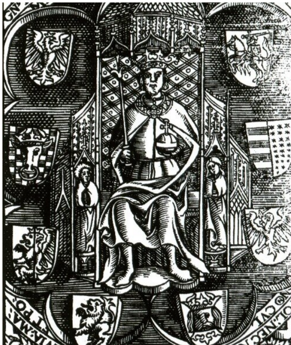
Pieczęć Kazimierza Jagiellończyka.