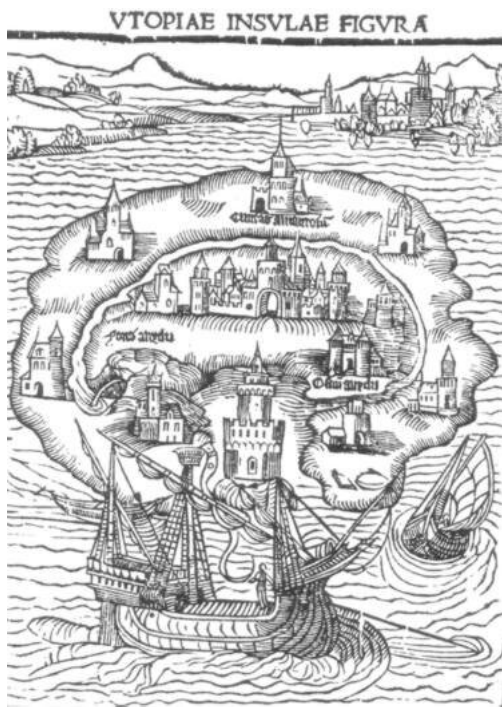
Wyspa Utopia. Drzeworyt z pierwszej edycji dzieła o tym samym tytule, Louvain 1516.

Wyspa Utopia ciągnie się w pasie środkowym, najszerszym, na dwieście tysięcy kroków; znaczna jej część niewiele jest węższa i od środka stopniowo zwęża się ku punktom końcowym. Kształt całej wyspy przypomina ćwiartkę księżyca [...]. Ten wielki jakby basen wypełnia woda morska, lecz ponieważ otaczające go półkolem wybrzeże stanowi dobrą osłonę od wiatrów, przeto te masy wód robią wrażenie raczej spokojnego jeziora niż