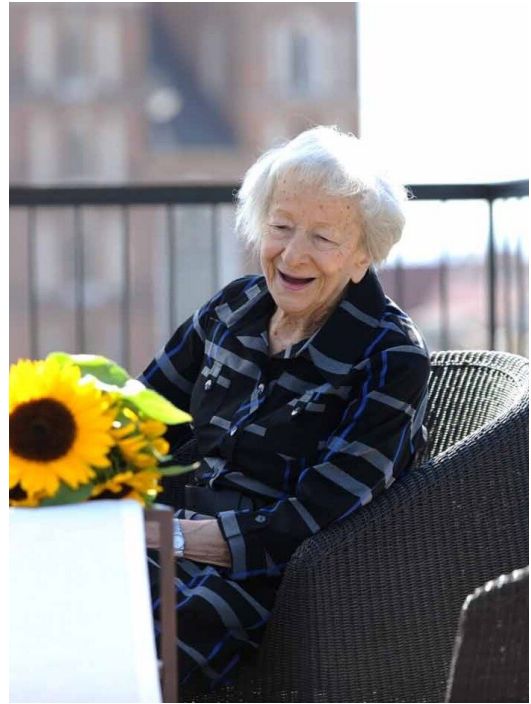
Wisława Szymborska w Krakowie w 2010 r.

Ilościowo dorobek literacki poetki można by uznać za skromny, bo liczy jedynie około 350 wierszy, ale jest on niezwykle dopracowany. Charakteryzuje się precyzją wyrażania i troską o poetyckie szczegóły, jednak najważniejszą cechą tej poezji jest poczucie humoru i ironia .