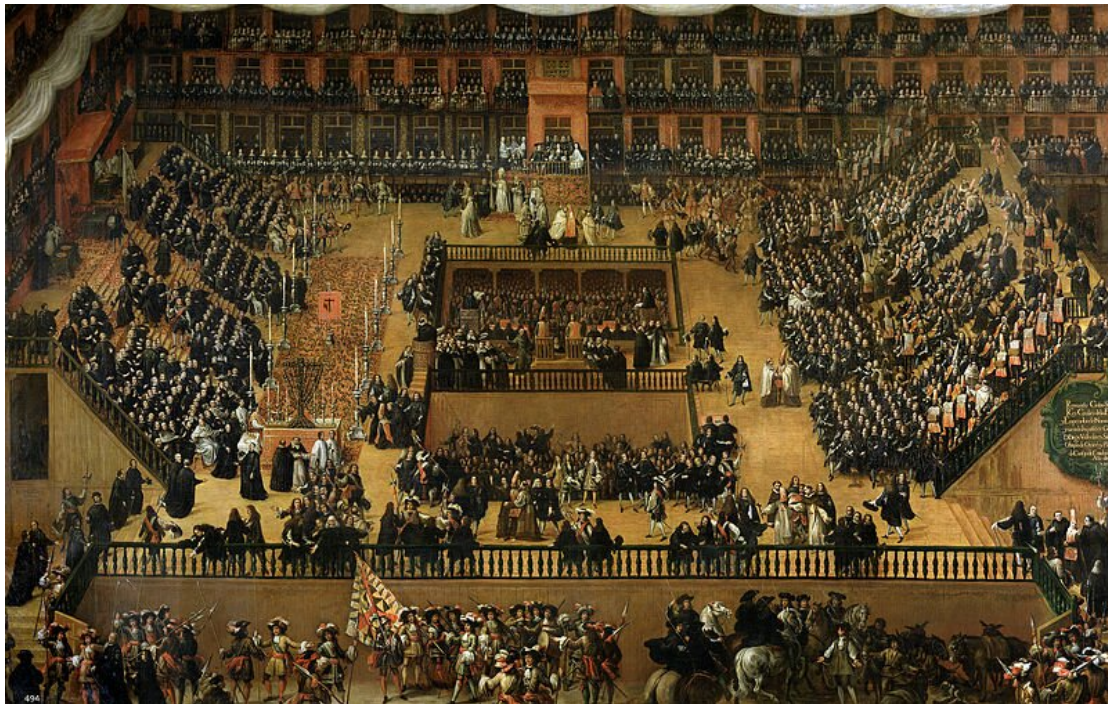
Ceremonia ogłoszenia wyroków przez inkwizycję w Madrycie w 1680 r. w obecności króla Karola II na obrazie Francisca Rizi z 1683 r. Jakie wnioski o znaczeniu tej instytucji można wysnuć na podstawie obrazu?

natomiast rozwijające się szkolnictwo parafialne i zakonne poszerzało grono ludzi wykształconych.