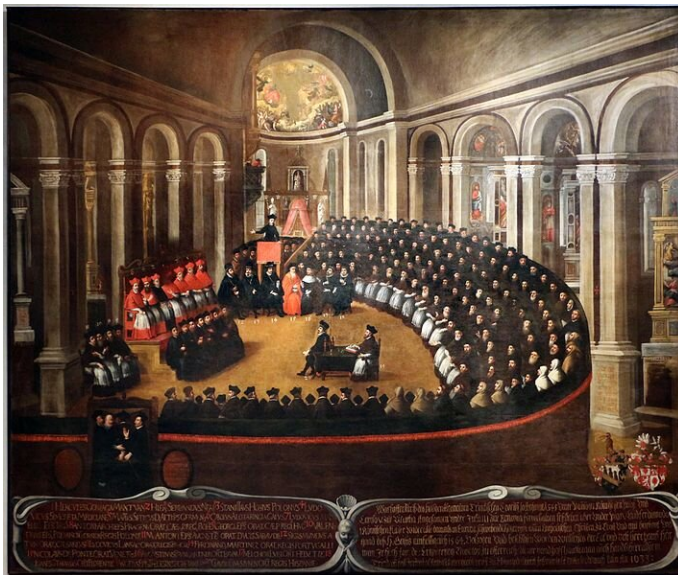
Elia Naurizio, Kongregacja generalna na soborze trydenckim , 1633 r.