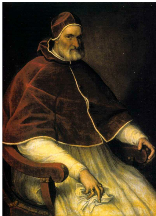
Portret Piusa IV, autor z kręgu Tycjana.

Sakramencie Eucharystii - przeistoczenie (sesja 13 -