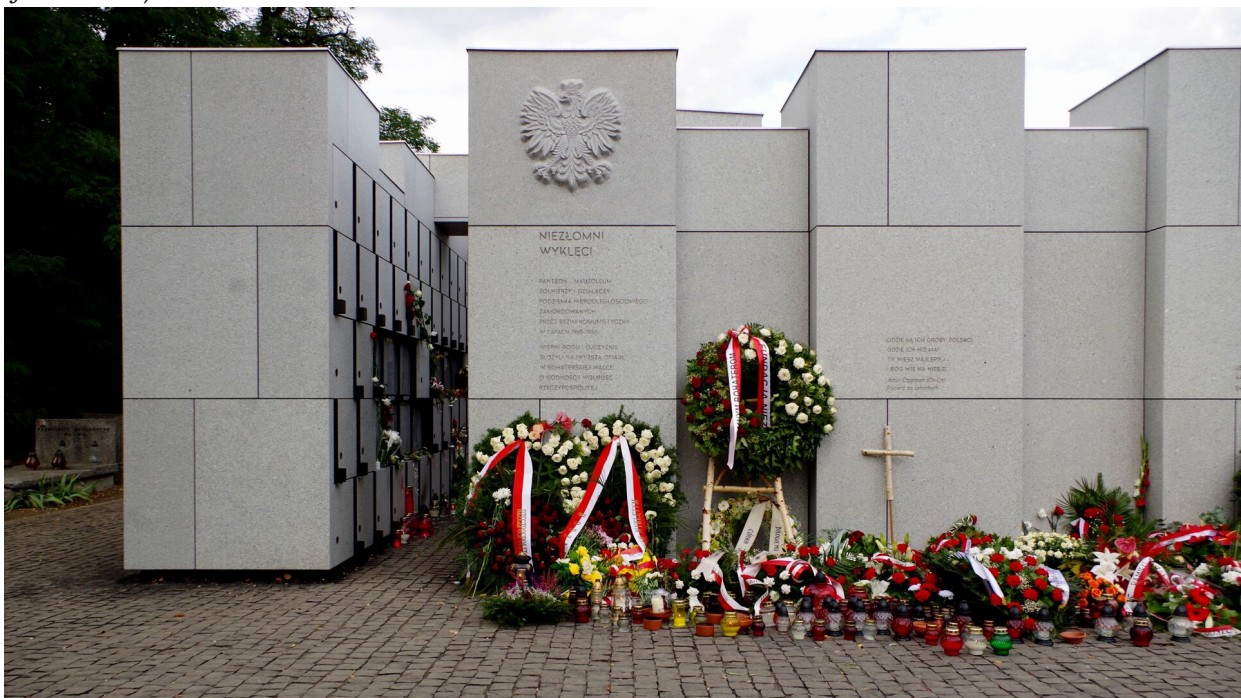
Panteon - Mauzoleum Wyklętych-Niezlomnych na Cmentarzu Wojskowym na Powązkach w Warszawie

Władze komunistyczne próbowały także w celu opanowania sytuacji w kraju wykazać się 'dobrą wolą', kiedy działanie 'przez strach' nie przynosiło właściwego efektu. W sierpniu 1945 roku po raz pierwszy TRJN wprowadził amnestię . Skorzystało z niej około 30 tys. osób. Z kolejnej, ogłoszonej w lutym 1947 roku, skorzystało 75 tys. Nie wszystkie oczywiście osoby, które się ujawniły, walczyły w podziemiu zbrojnym. Po amnestii pozostało jeszcze około 2 tys. ukrywających się. Nazwano ich ' żołnierzami wyklętymi/niezlomnymi ' (zdecydowali się na walkę do końca mimo braku szans na zwycięstwo, przez lata byli 'wyklęci' z oficjalnej wersji historii).