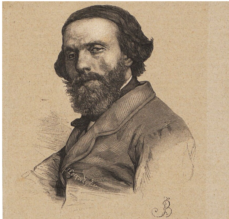
Portret Cypriana Kamila Norwida wykonany przez Józef Łoskoczyńskiego

Jak się nie nudzić? – ironiczne refleksje Norwida na temat salonów romantycznych