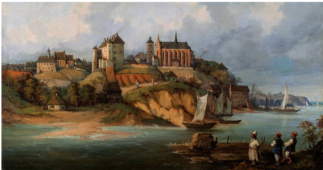
Józef Szermentowski, Widok Sandomierza od strony Wisły , 1855

Oprócz naukowej etymologii występuje też zjawisko etymologii ludowej. Jest to błędne objaśnianie pochodzenia niektórych słów przez najprostsze skojarzenia z innymi. Tak np. Sandomierz niektórzy tłumaczą jako ‘miejsce, gdzie San domierza (dochodzi) do Wisły’. Naukowa etymologia jest w stanie udowodnić, że pierwotne znaczenie tej nazwy to po prostu ‘gród Sędomira’.