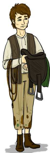
marahskalk chłopak do koni

Zdarzają się wreszcie wypadki kolejnego zwężania i rozszerzania wartości wyrazu, co daje w rezultacie jak gdyby przenośnię. I tak np. staro-wysoko-niemiecki wyraz marahskalk 'chłopak do koni', przechodząc we wczesnym średniowieczu z języka ogólnego do języka specjalnego francuskiego dworu królewskiego, przybrał węższe znaczenie 'królewski funkcjonariusz opiekujący się końmi, koniuszy'. Ten sam wyraz, przechodząc następnie z powrotem do języka ogólnego, rozszerzył swe znaczenie w innym kierunku i stał się wysokim tytułem wojskowym w ogóle: francuskie marechal . Wyraz ten zapożyczony do języka polskiego został rozszerzony nawet na dostojników świeckich, np. marszałek sejmu .