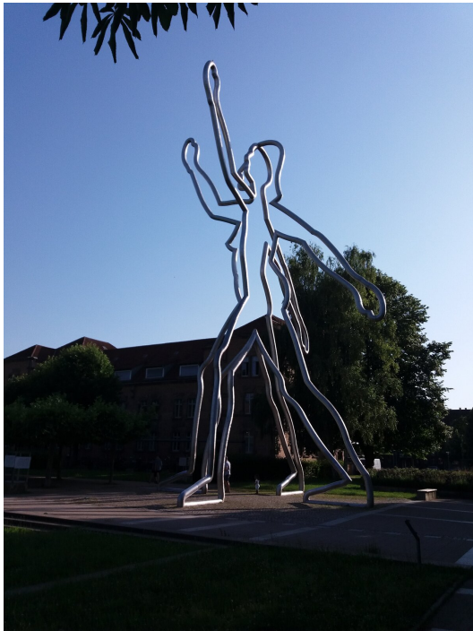
Jonathan Borofsky, Wolność (Kobieta / Mężczyzna) , 2019, rzeźba w Offenburgu.