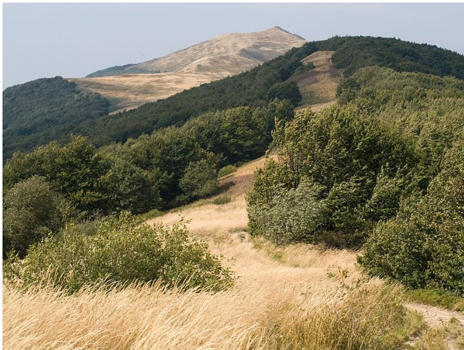
Góra Smerek w Bieszczadach