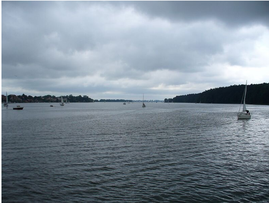
Śniardwy – największe jezioro w Polsce

spokojniej spędzić czas wolny również znajdą tu coś dla siebie. Promując Mazury, nie można również zapomnieć o Kanale Elbląskim, który jest wyjątkowym obiektem, oryginalnym w skali Europy.