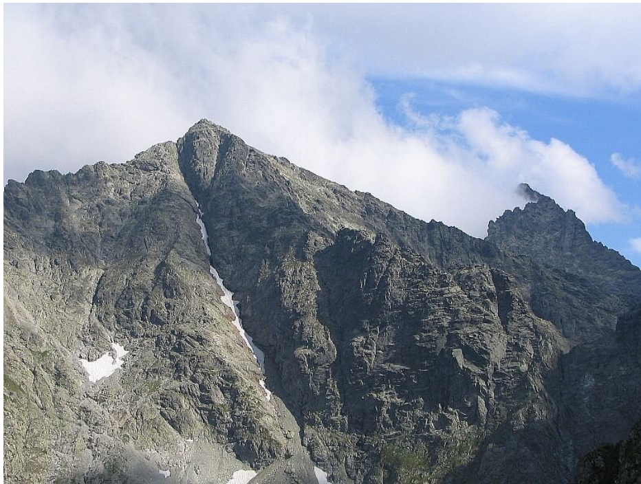
Rysy – najwyższy szczyt polskich Tatr

w regionie znajduje się bardzo dobrze rozbudowana infrastruktura służąca uprawianiu sportu. Warto więc zachęcać fanów nart i snowboardu do odwiedzenia tych gór.