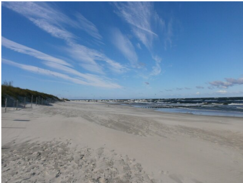
Plaża w Dziwnowie nad Morzem Bałtyckim