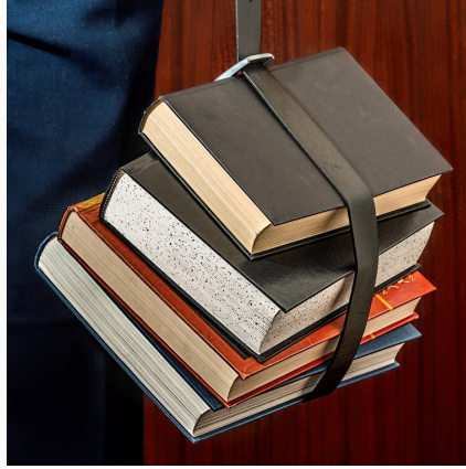
Prawo karne cz. 2