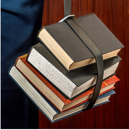
Prawo karne cz. 1