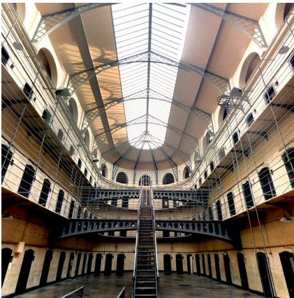
Kary i środki karne obowiązujące w polskim prawie