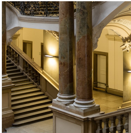
Zasady wnoszenia apelacji i kasacji w sprawach karnych