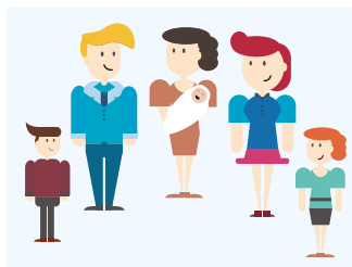
To ja i moja rodzina!