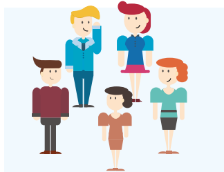
Jak fajnie spotkać się po lekcjach!