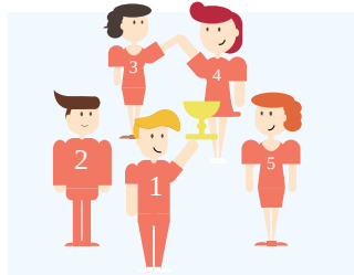
Sukces! Moja drużyna wygrała turniej!