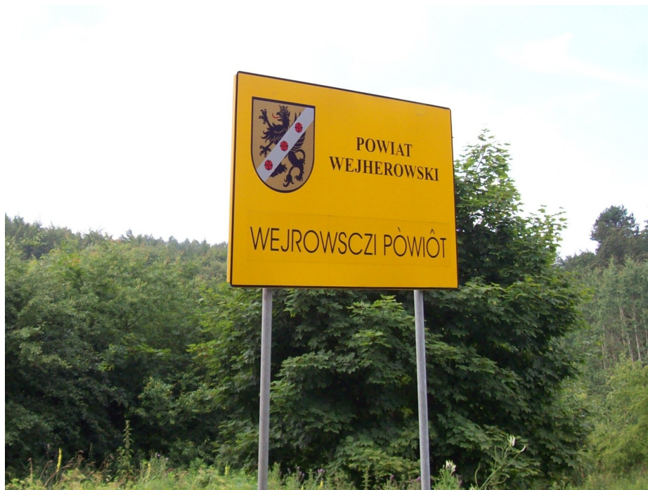
Tablica informacyjna w językach polskim i kaszubskim