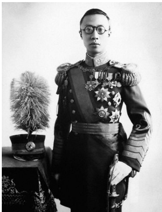
Cesarz Puyi – władca Mandżukuo