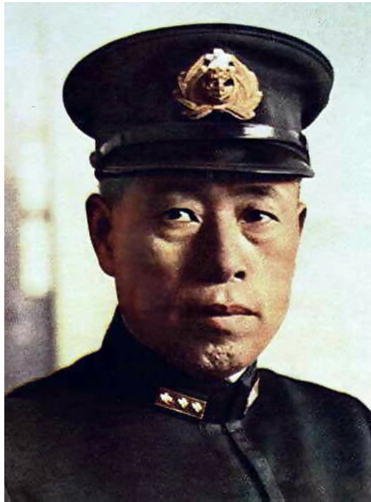
Admirał Isoroku Yamamoto