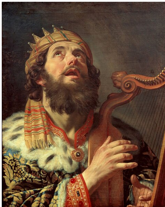
Król Dawid grający na harfie

Źródło: Gerard van Honthorst, 1622, Centraal Museum in Utrecht, domena publiczna.