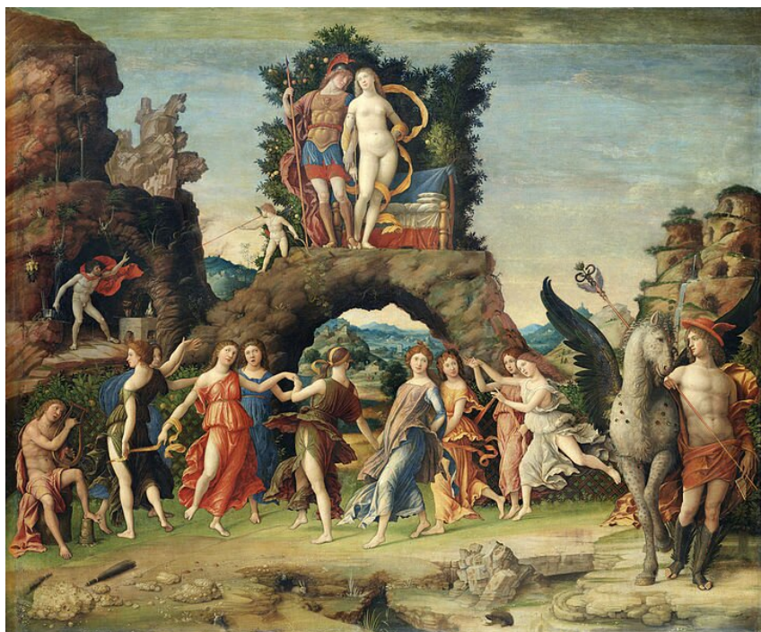
Parnas (inny tytuł Mars i Wenus )

Mantegna przedstawił na obrazie tańczące muzy. Policz, ile ich jest, i postaraj się przypisać im różne dziedziny sztuki. Następnie sprawdź w dowolnym źródle, czy twoja lista dziedzin podległych muzom zgadza się z tą, którą ustalono w starożytności.