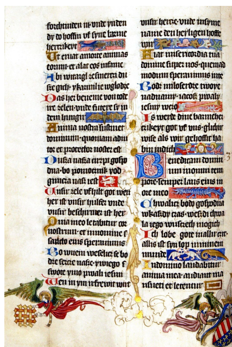
Karta Psalterza królowej Jadwigi przechowywanego w Bibliotece Narodowej.

Źródło: Gerard van Honthorst, 1622, Centraal Museum in Utrecht, domena publiczna.