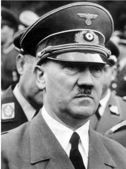
Adolf Hitler, Führer III Rzeszy