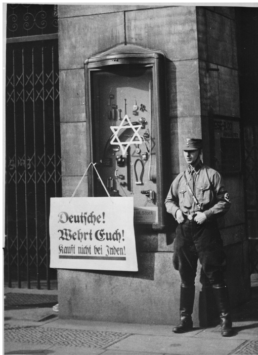
Bojkot żydowskiego handlu i usług 1 kwietnia 1933 r. Placówki takie jak sklepy, warsztaty rzemieślnicze, zakłady usługowe były oznaczane i pilnowane przez umundurowanych funkcjonariuszy, których obecność miała odstraszać potencjalnych klientów.

W ideologii nazistowskiej walka z Żydami urosła do rangi olbrzymiego przedsięwzięcia. Nie tylko Niemcy zostają do niego włączeni. Los wszystkich innych narodów zależy ostatecznie, według nazistów, od rozstrzygnięcia wielkiej bitwy z Żydami, którzy stanowią praprzyczynę wszelkiego zła na świecie. Propaganda nazistowska nie przebiera w środkach, nazywając Żydów „zarazą”, „pasożytami” czy „odwiecznymi bakcydami ludzkości”. Losy świata wydają się zależeć od pokonania tego wroga. Hitler pisał: „Jeżeli Żyd za pomocą swego marksistowskiego wyznania wiary odniesie zwycięstwo nad narodami tego świata, korona jego będzie wieńcem żałobnym ludzkości, a planeta nasza będzie jak ongiś przed milionami lat krążyła w eterze całkowicie wyludniona”.