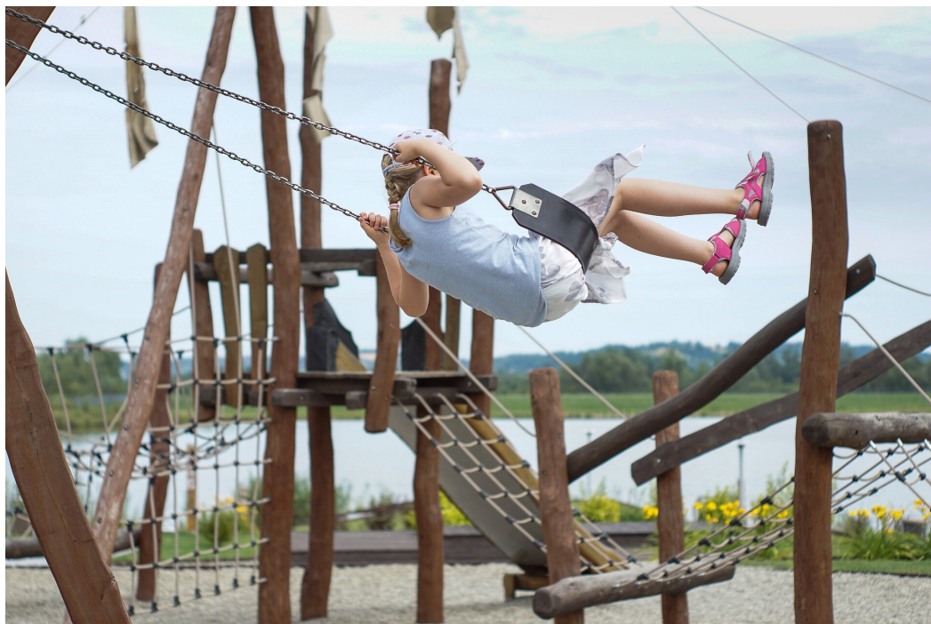
Rys. 1. Aby rozbijać huśtawkę, czyli uzyskać maksymalną amplitudę drgań, należy działać na nią siłą periodyczną o częstotliwości zbliżonej do częstotliwości drgań własnych huśtawki

Oczywiście w realnym świecie zawsze występują siły oporu, które w końcu powodują wygaszenie drgań. Jeśli zależy nam na podtrzymaniu drgań, musimy na układ działać periodyczną siłą wymuszającą. Znanym wszystkim z własnego doświadczenia przypadkiem wymuszania drgań jest rozbijanie huśtawki (Rys. 1.). Aby to się udało, należy popychać huśtawkę z dokładnie określoną częstotliwością. Działanie siły musi być zgodne ze swobodnym ruchem huśtawki. Inaczej mówiąc, częstotliwość siły wymuszającej musi być zbliżona do częstotliwości drgań własnych. Jeśli będziemy popychali huśtawkę w innym rytmie, ruch huśtawki będzie bezładny a wychylenia z położenia równowagi niewielkie.