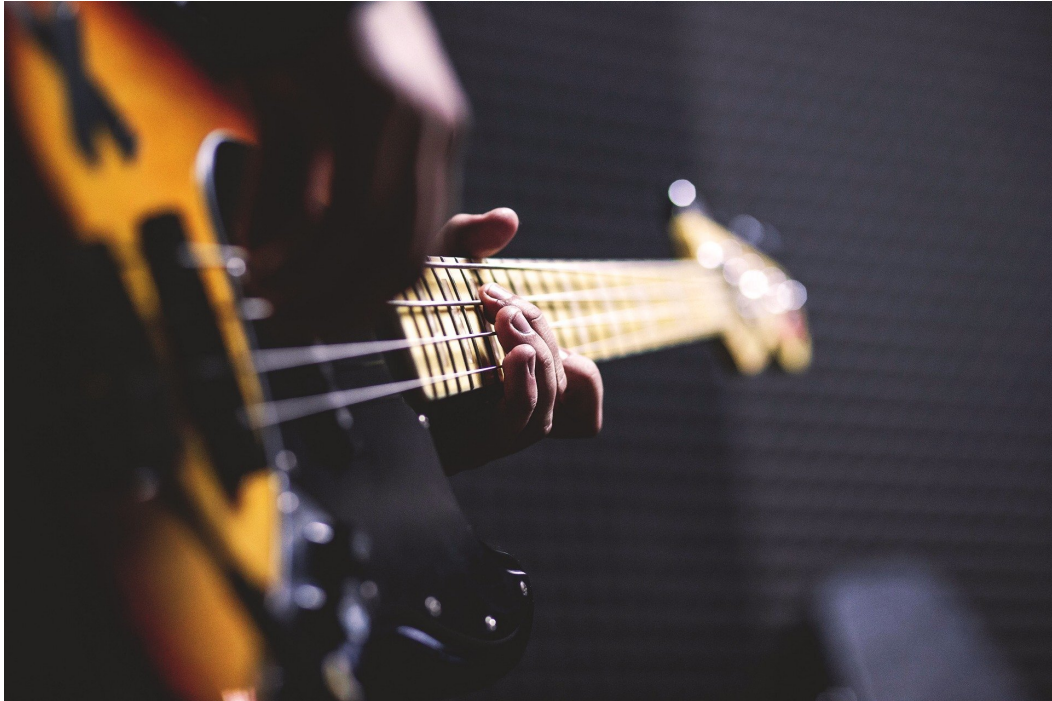
Rys. 3. Muzyk szarpie za struny gitary basowej

„wybierają” sobie tę częstotliwość, która jest najbliższą ich częstotliwości rezonansowej i właśnie z taką drgają.