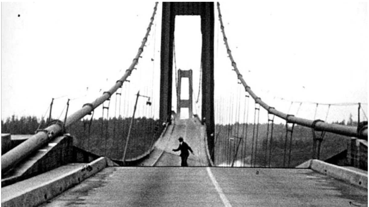
Rys. a. Katastrofa na moście w miejscowości Tacoma w Stanach Zjednoczonych

Czy wiesz, że w 1940 roku prawie dwukilometrowy most w miejscowości Tacoma w Stanach Zjednoczonych uległ całkowitej destrukcji w katastrofie spowodowanej zjawiskiem rezonansu?