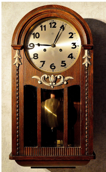
Rys. 4. Zegar wahadłowy