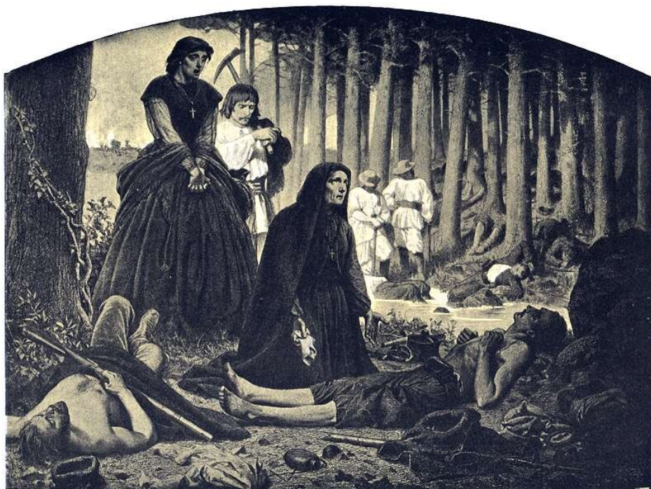
Artur Grottger, Na pobojowisku , 1863

Przyjrzyj się rysunkowi Artura Grottgera Na pobojowisku pochodzącemu z cyklu Polonia oraz przeczytaj fragment opowiadania Rozdzióbią nas kruki, wrony . Wskaż i omów dwie różnice w sposobie ukazania śmierci powstańczej w opowiadaniu i dziele Grottgera.