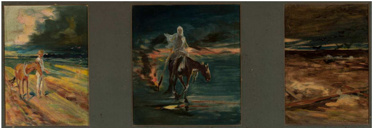
Adam Chmielowski, Czarne chmury. Śmierć. Pomór, tryptyk „Klęska” , 1870