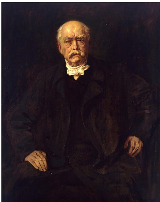
Portret Ottona von Bismarcka namalowany przez Franza von Lenbacha, 1879.

Prawa socjalne należą do praw człowieka drugiej generacji . Ich koncepcja upowszechniła się w XIX i XX wieku, na skutek powstania kapitalizmu oraz społecznych problemów, jakie ten system wytworzył. Szybki rozwój gospodarki opartej na przemyśle wiązał się z powstaniem ogromnych nierówności społecznych oraz pauperyzacją robotników. Prowadziło to dodatkowo do radykalizacji coraz większych grup ludności i upowszechnienia się nastrojów rewolucyjnych.