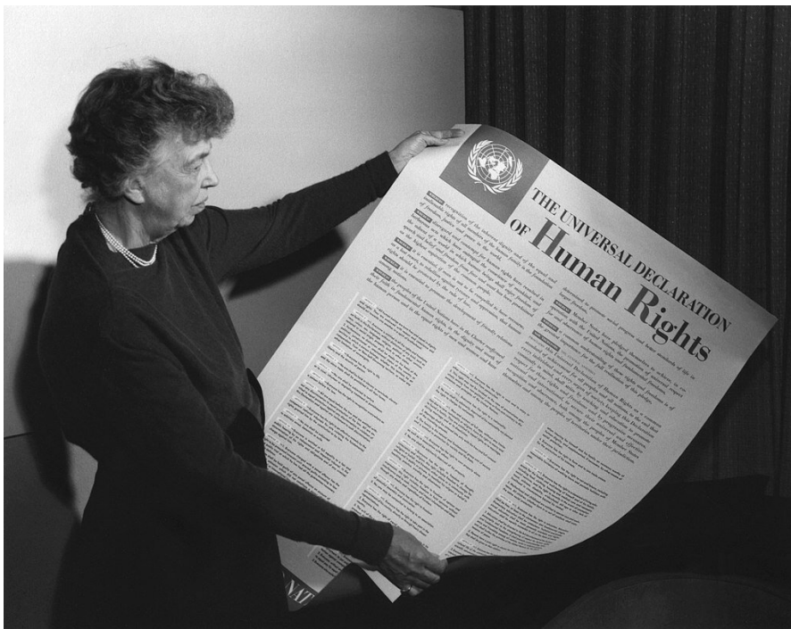
Eleanor Roosevelt z Powszechną deklaracją praw człowieka.

Idea socjalnych praw człowieka w XX wieku weszła na stałe do programów politycznych wielu partii, zwłaszcza lewicowych. Po II wojnie światowej ich realizacja przez władze publiczne stała się standardem we wszystkich krajach europejskich – zarówno w komunistycznych, jak i zachodnich welfare states . Prawa te włączano do konstytucji państw; stały się one również przedmiotem regulacji międzynarodowych.