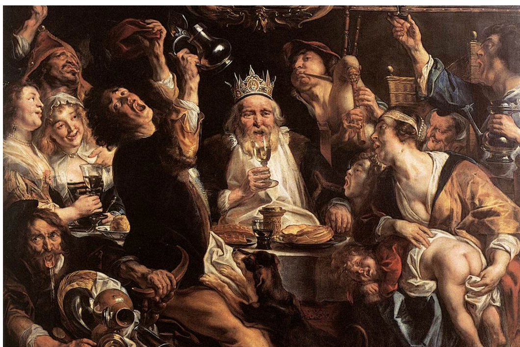
Jacob Jordaens, Król pije , ok. 1638.

Tak, zdaniem Nietzschego, powstaje chrześcijaństwo. Suto zastawiony stół to metafora życia, chorzy zaś to wszyscy ci, którzy nie mają sił, by podołać obfitości i różnorodności wyznań, jakie niesie ze sobą życie. Za