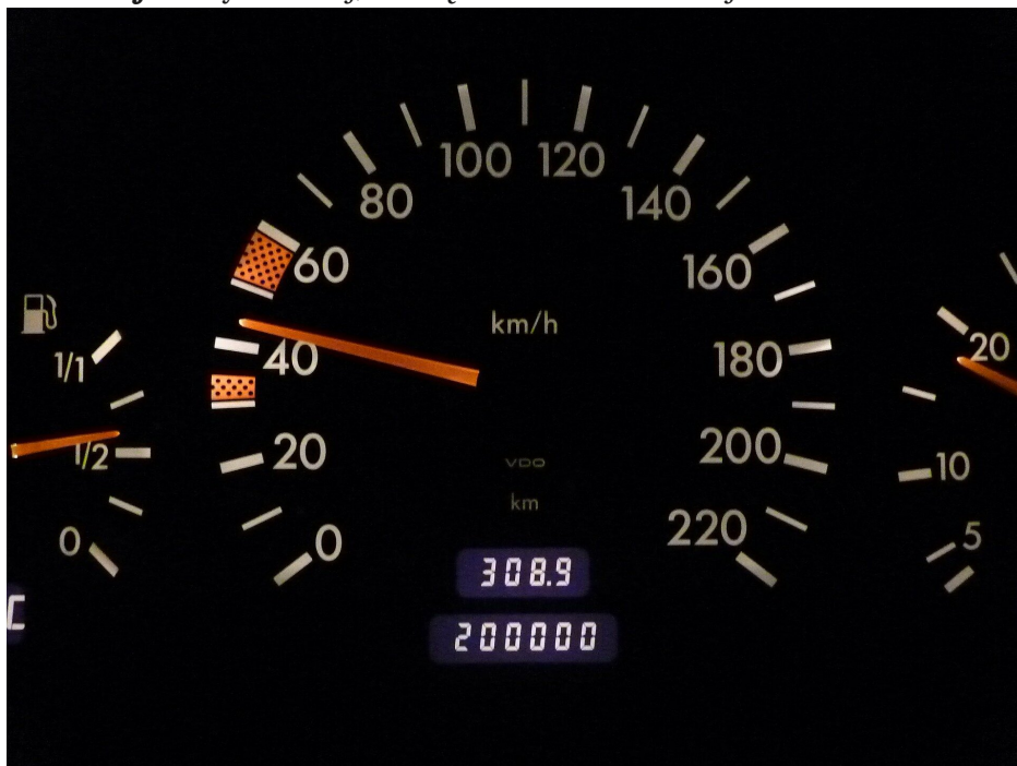
Rys. 2. Prędkościomierz w samochodzie mierzy wartość prędkości chwilowej.

Prędkość w czasie ruchu może się zmieniać, więc aby określić ją jak najdokładniej, czas, w którym obserwujemy zmianę położenia, musi być jak najkrótszy. Mówimy wtedy o prędkości chwilowej – czyli takiej, którą ciało ma w danej chwili.