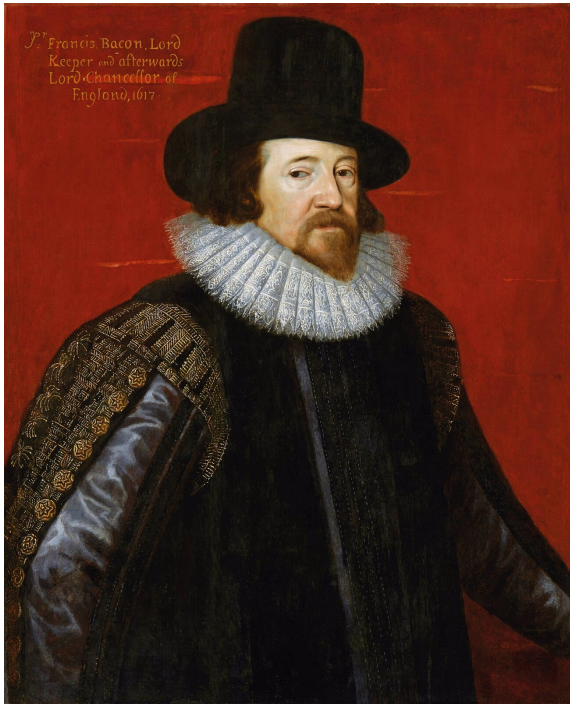
Francis Bacon (1561–1626). Angielski filozof, prekursor filozoficznego renesansu, zwolennik empiryzmu (uprawiania filozofii w oparciu o doświadczenie zmysłowe). Bacon opracował nowe metody badawcze i nowy podział nauk, czym waleńie przyczynił się do wypracowania renesansowego sposobu rozumienia i uprawiania filozofii, jak i nauk szczegółowych. Paul van Somer, Portret Francisa Bacona (1617).

otaczającą nas rzeczywistość, przenikać jej tajemnice i ujmować je w racjonalne matematyczne (ściśle) prawa. Rozum, pomimo całej swej potęgi, pozostaje jednak narzędziem równie ograniczonym, co sam człowiek. Nie jest bowiem w stanie przeniknąć i zbadać kwestii ostatecznych, dotyczących nieskończoności kosmosu, odwieczności czasu, natury Boga czy duszy ludzkiej. Zagadnienia wiary przynależą bowiem do porządku serca i z konieczności musimy je przyjmować na wiarę. Z tego podziału wynikają zaś dwie kolejne idee Pascala – trzciny na wietrze i zakładu Pascala, które dopiero teraz można poprawnie zrozumieć.