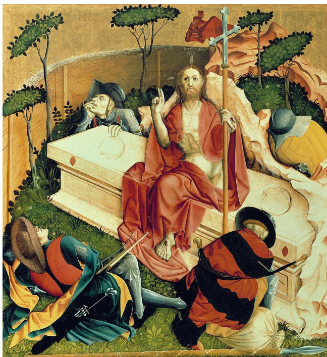
Hans Multscher, Zmartwychwstanie – fragment ołtarza z Wurzach, 1437

Nie ma dowodów na istnienie średniowiecznych moralitetów pisanych polszczyzną, natomiast na pewno już w XIII stuleciu odbywały się widowiska wchodzące w skład obrzędów liturgicznych. Najstarszy scenariusz przedstawienia, spisany około 1253 roku, dotyczył inscenizacji towarzyszących Niedzieli Palmowej oraz ukazywał tzw. nawiedzenie Grobu, czyli udanie się trzech Marii do miejsca złożenia ciała Jezusa po jego śmierci.