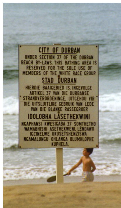
Plaża „tylko dla białych” (Durban, 1989)

W życiu codziennym oznaczało to wiele utrudnień i zakazów dla ludzi o innym kolorze skóry niż biali. Tak zwana przez białych „ludność kolorowa” musiała sprostać dziesiątkom ograniczeń oraz dyskryminujących ją praw i regulacji. Ludzie ci mieli zakaz zrzeszania się w związkach zawodowych, ich płace za taką samą pracę były o wiele niższe niż osób zaliczanych do rasy białej. W przypadku trwałego inwalidztwa spowodowanego wypadkiem w miejscu pracy miesięczna pensja białego niepełnosprawnego wynosiła więcej niż jednorazowa rekompensata wypłacana pracownikom o odmiennym kolorze skóry (oczywiście nie mogli oni liczyć na regularną rentę). W 1955 roku zniesiono obowiązek szkolny dla osób czarnoskórych i wprowadzono zakaz studiowania na uczelniach „dla białych”. Otwierano specjalne uniwersytety dla innych ras, gdzie poziom kształcenia był o wiele niższy, co na starcie zmniejszało szanse na lepszą pracę w przyszłości i skutkowało pogłębianiem się nierówności społecznych.