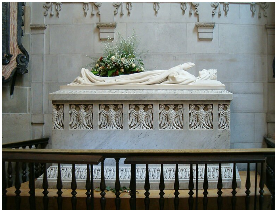
Sarkofag, czyli zdobiona trumna, Jadwigi Andegaweńskiej w Katedrze na Wawelu