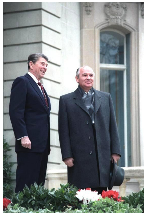
Pierwsze spotkanie prezydenta USA Reagana z sekretarzem generalnym ZSRR Gorbaczowem we Fleur d'Eau podczas szczytu w Genewie w Szwajcarii w 1985 r. Przywódcy rozmawiali o ograniczeniu wyścigu zbrojeń i poprawie wzajemnych stosunków.

polityki Gorbaczowa na arenie międzynarodowej stało się zatem doprowadzenie do kontroli zbrojeń, ukrywane pod propagandowym hasłem „ofensywy pokojowej”. Pięć spotkań przywódców Stanów Zjednoczonych i ZSRR w latach 1985–1988 przyniosło ogromne zmiany we wzajemnych relacjach między obydwojma supermocarstwami i przyczyniło się do spadku napięcia