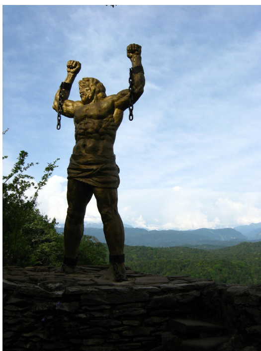
Prometeusz w Soczi

Rzeźbę przedstawiającą Prometeusza można zobaczyć w otoczonym górami Kaukazu rosyjskim mieście Soczi (gdzie – według niektórych – mitologiczny tytan był uwięziony). Wyjaśnij, co wyraża postawa Prometeusza.