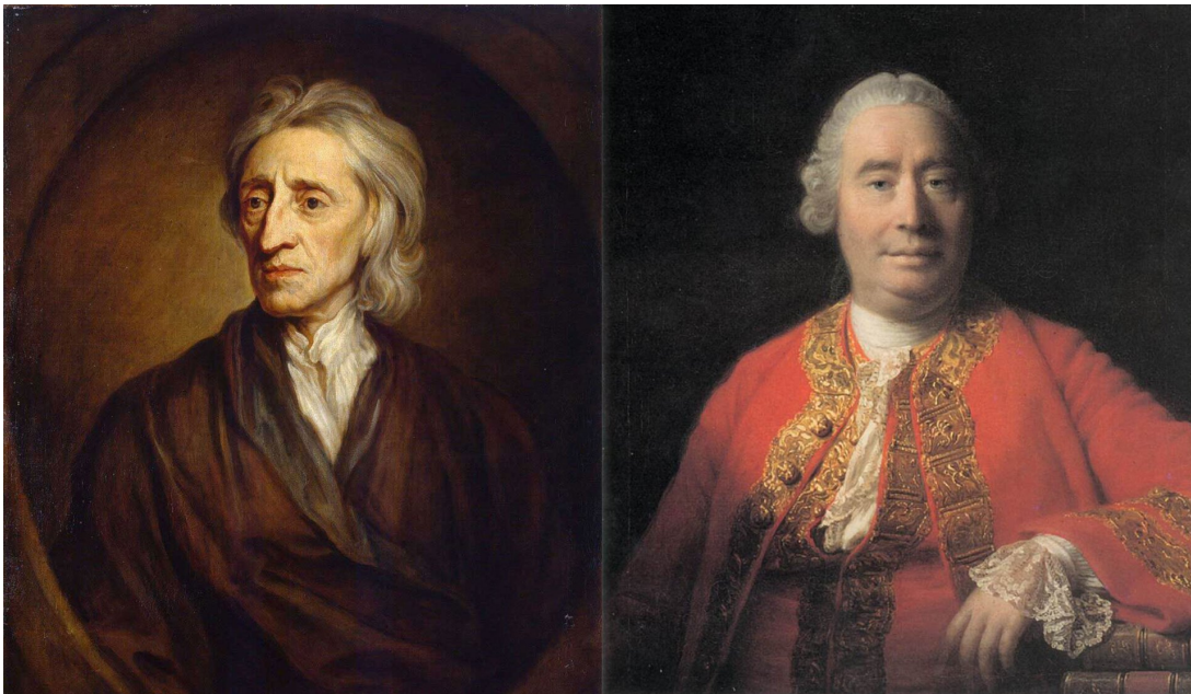
John Locke (1632–1704)

Empiryzm w szerokim znaczeniu – jako stanowisko upatrujące podstaw wiedzy w świadectwach zmysłów – ma długą tradycję. W starożytności z doświadczenia wiedzę wywodzili epikurejczycy i stoicy, do pewnego stopnia także Arystoteles, w średniowieczu zaś Tomasz z Akwinu, który choć uznawał prymat teologii i prawd objawionych, w świeckich naukach i filozoficznej refleksji nad światem widział drogę do częściowego poznania Boga. W filozofii kontynentalnej za ojca nowożytnego empiryzmu uchodzi XVII-wieczny myśliciel i matematyk Pierre Gassendii.