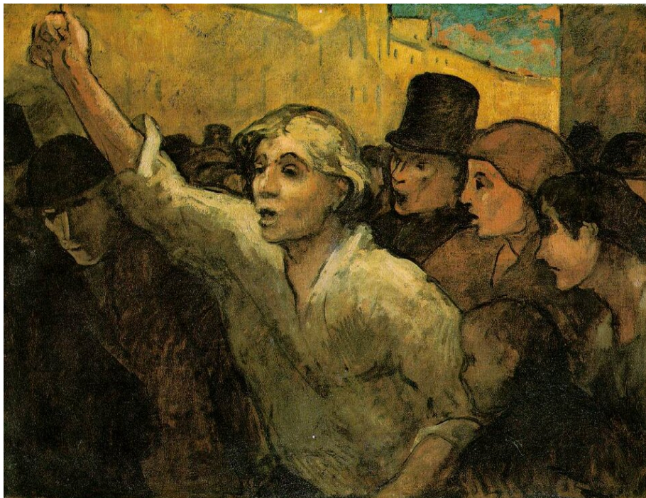
Honoré Daumier, Powstanie , XIX w.