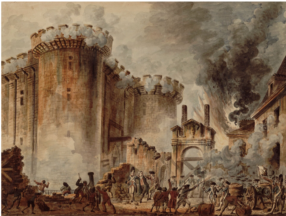
Jean-Pierre Houël, Szturm na Bastylię , 1789