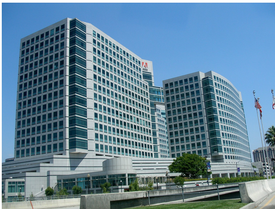
Główna siedziba Adobe Systems w Dolinie Krzemowej

Rozwój przemysłów zaawansowanych technologii wiąże się z III rewolucją przemysłową opartą na wynalazkach i osiągnięciach naukowych takich jak półprzewodniki, tranzystory, światłowody, biotechnologie czy energia atomowa. Przemysły high-tech są motorem rozwoju gospodarczego wielu krajów, zwłaszcza wysoko rozwiniętych. Odzwierciedlają one tendencje zmian w strukturze gałęziowej przemysłu.